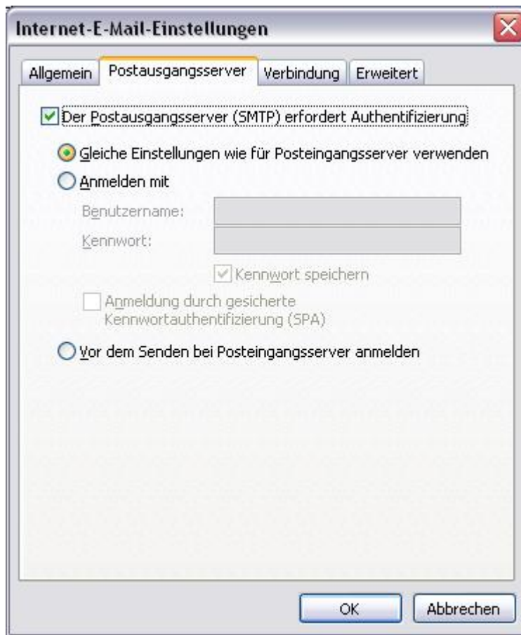
Abbildung 3: Authentifizierung am Postausgangsserver (SMTP)