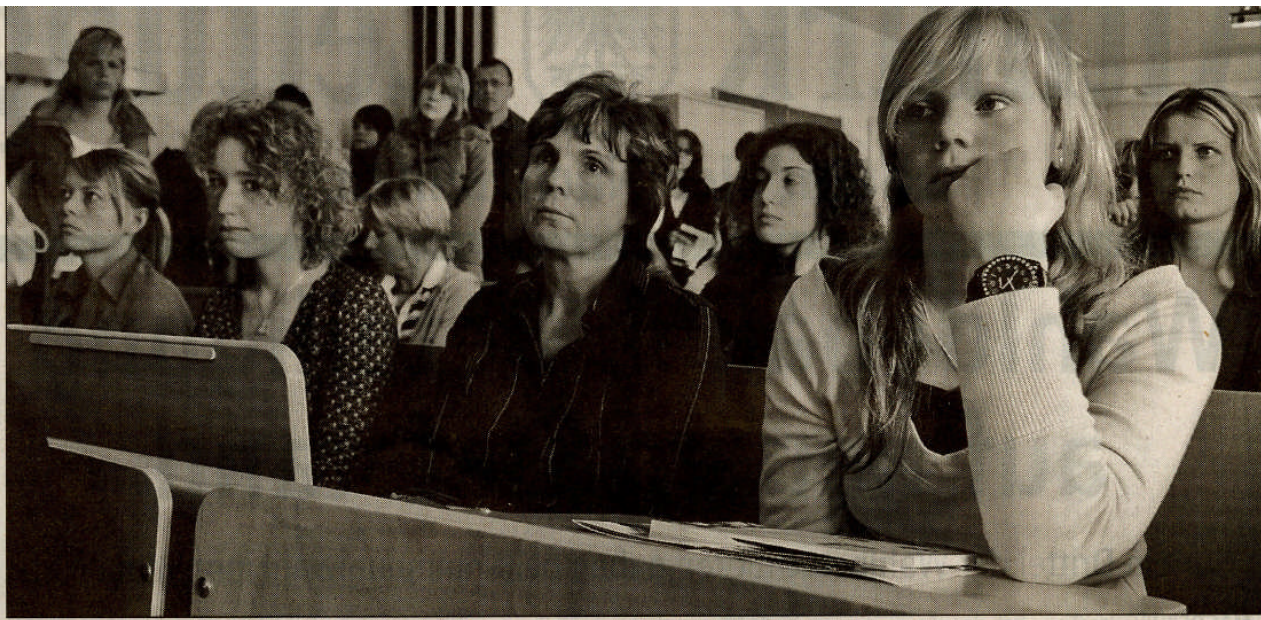
Rehabilitationspsychologie interessiert vor allem junge Frauen. Der Hörsaal zur Auftaktveranstaltung am Tag der offenen Tür Sonnabendvormittag ist mehr als gut gefüllt. Hunderte strömen auf das FH-Gelände.